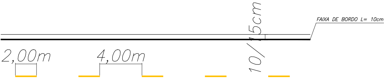
DETALHE – FAIXA AMARELA DE DIVISÃO DE FLUXO – LINHA SIMPLES SECCIONADA Sem escala