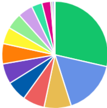
DFDs POR ÁREA DEMANDANTE